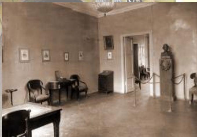
Кабинет А. С. Пушкина. Экспозиция 1927 года