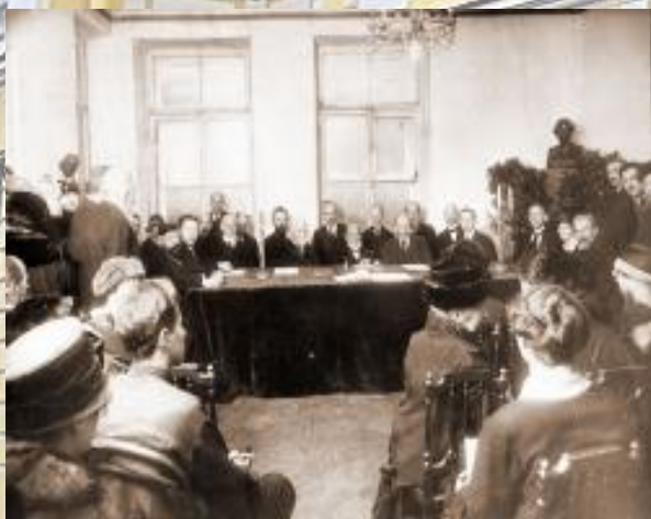
Первое памятное собрание в гостиной квартиры А. С. Пушкина. 10 февраля 1925 года

О том, что происходило с Пушкиным в последние месяцы его жизни, чем были заняты его мысли, что составляло жизнь его семьи в самом конце 1836 — начале 1837 года, рассказывает музей в мемориальной квартире поэта, расположенный в бывшем особняке князей Волконских.