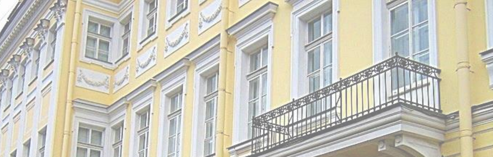
Мемориальный музей-квартира А. С. Пушкина