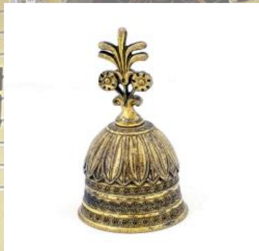
Колокольчик настольный для вызова прислуги