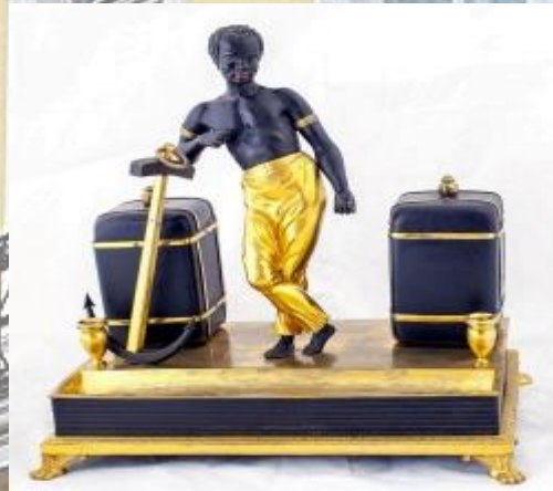
Чернильница А. С. Пушкина