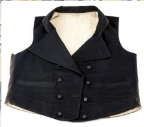
Жилет А. С. Пушкина