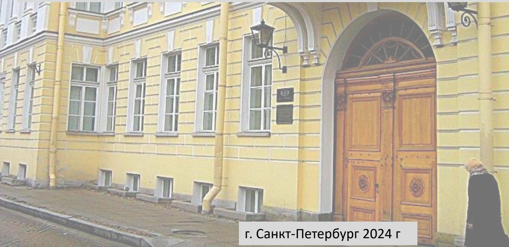
г. Санкт-Петербург 2024 г