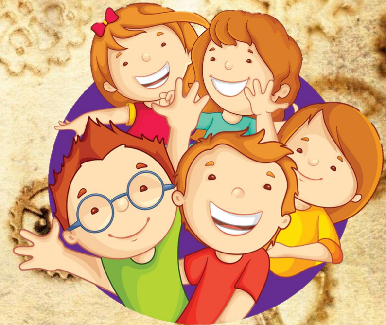
Дети старшей группы