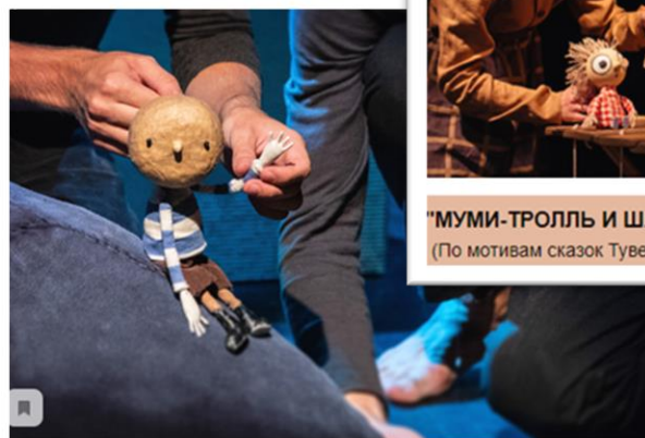
"ДЕНЬ, КОГДА Я ВСТРЕТИЛ КИТА"