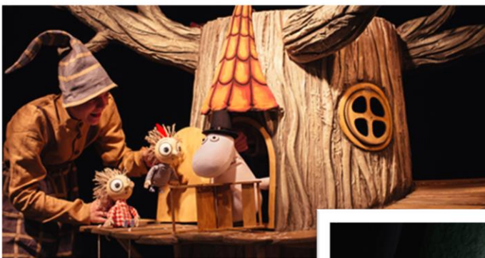
"МУМИ-ТРОЛЛЬ И ШЛЯПА ВОЛШЕБНИКА" (По мотивам сказок Туве Янссон)