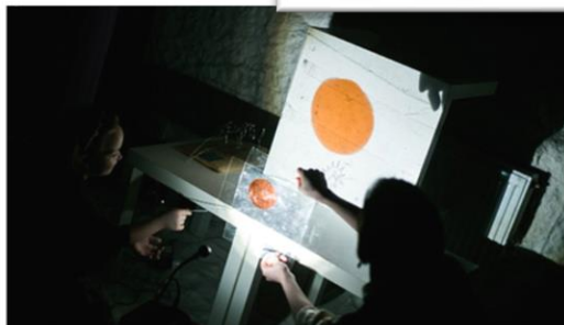
МАСТЕР-КЛАСС ПО ТЕНЕВОМУ ТЕАТРУ «СВЕТОНЬ»"