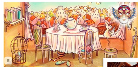
"ВЕРОЯТНО, ЧАЕПИТИЕ СОСТОИТСЯ" (по мотивам произведений Льюиса Кэрролла «Алиса в Стране чудес» и «Алиса в Зазеркалье»)