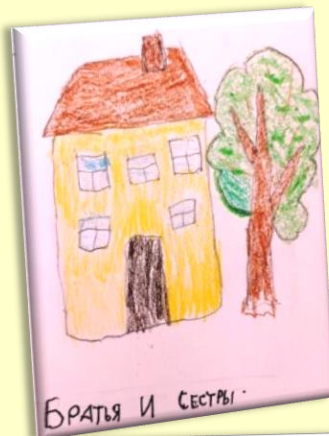
Даша, (5,8 лет)