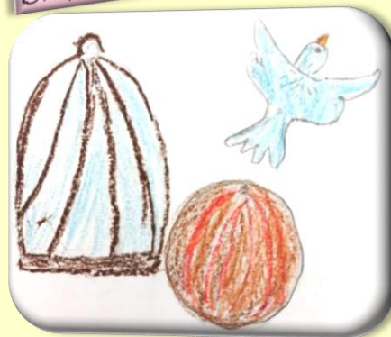
Соня, (6 лет)