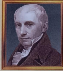
Жан-Франсуа Тома де Томон (1760–1813)