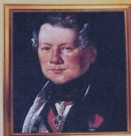
Огюст Рикар де Монферран (1786–1858)

Здания Главного штаба, Сената и Синода, Михайловский дворец, Александринский театр. Самая гармоничная улица Петербурга носит его имя (страница 40).