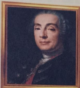
Бартоломео Франческо Растрелли (1700–1771)

Зимний дворец, Смольный монастырь, Большой дворец в Петергофе, Екатерининский дворец в Царском Селе. В Петербурге есть площадь его имени (страница 49).