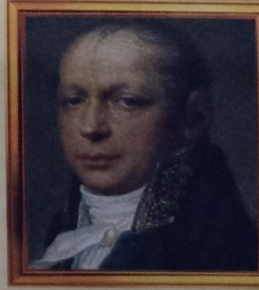
Андреян Дмитриевич Захаров (1761–1811)