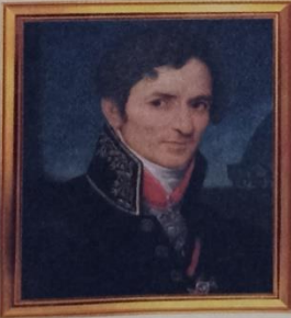
Андрей Никифорович Воронихин (1759–1814)

Михайловский замок (вместе с Винченцо Бренна).