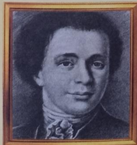
Василий Иванович Баженов (1737–1799)

Как построил Исаакий Монферран? Ведь ему не помогал подъемный кран!