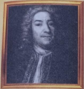
Доменико Андреа Трезини (1670–1734)

Петропавловский собор, Летний дворец Петра I, здание Двенадцати коллегий.