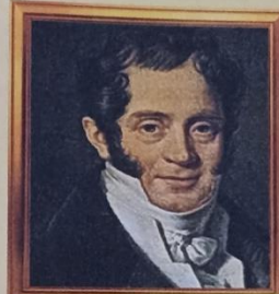
Карл Иванович Росси (1775–1849)

Зимний дворец, Смольный монастырь, Большой дворец в Петергофе, Екатерининский дворец в Царском Селе. В Петербурге есть площадь его имени (страница 49).