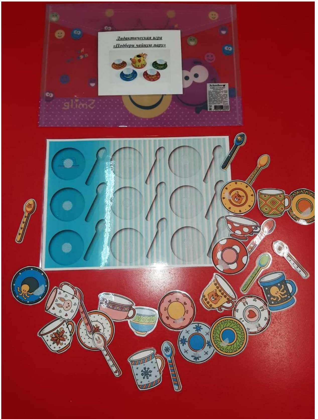
Д/И «Подбери чайную пару»