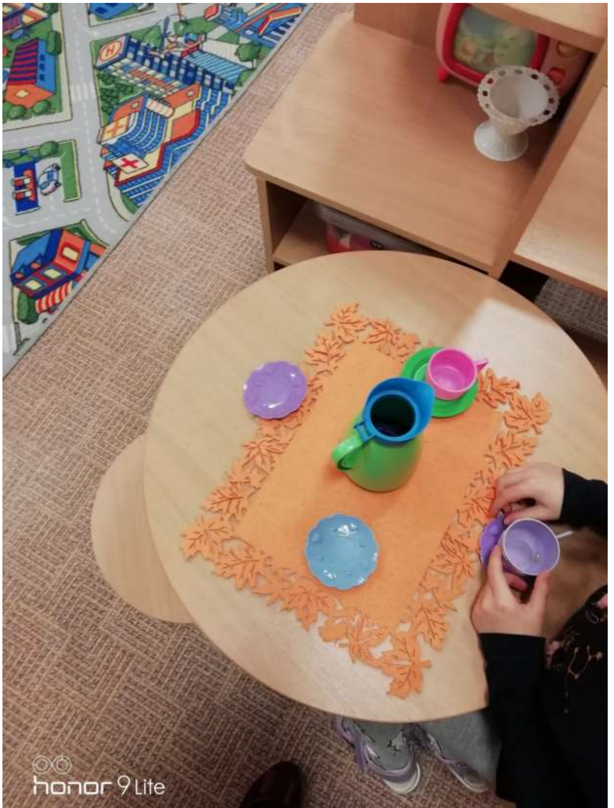
Ср.игра «Накрой на стол», «В гостях на чаепитии»