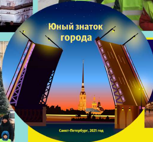
Юный знаток города