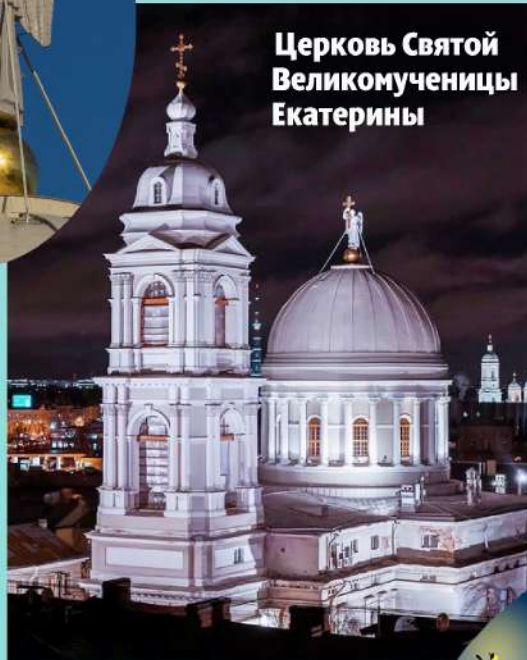
Церковь Святой Великомученицы Екатерины