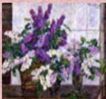
Сирень, 1952 г