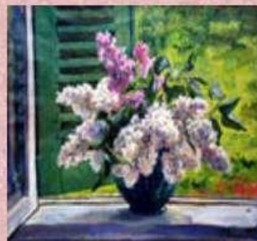
Сирень на фоне ставни, 1951 год