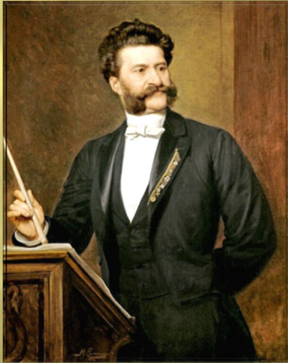
Иоганн Штраус (сын)