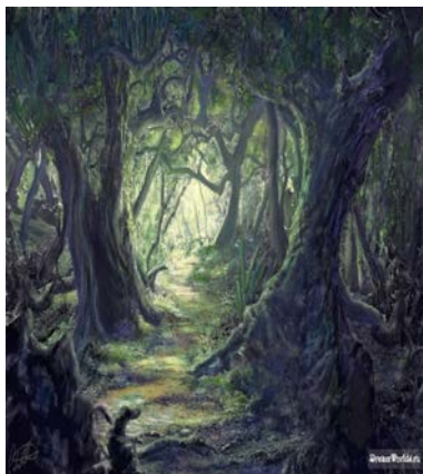
Лес Бабы Яги