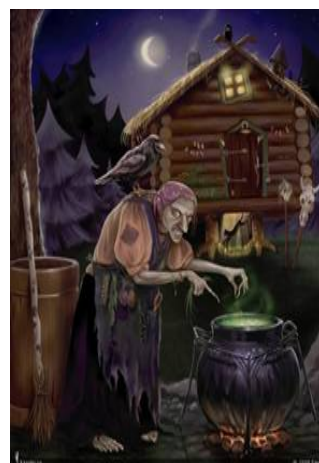
Баба Яга у чана