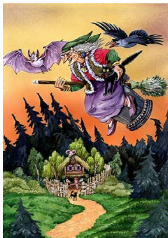
Баба Яга М.П. Мусоргского