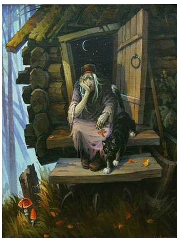
Задумчивая Баба Яга