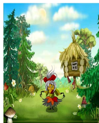
Веселая Баба Яга