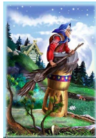
Баба-Яга П.И. Чайковского